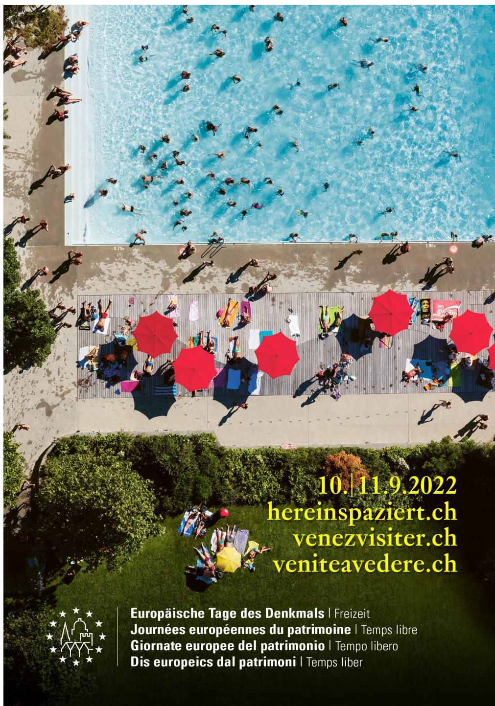
L'illustration des Journées du patrimoine 2022 est une vue aérienne de la piscine du Letzigraben à Zurich, dessinée par Max Frisch.