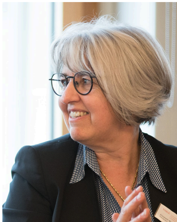
Elisabeth Baume-Schneider, présidente de l'Association du Centre NIKE en 2022.

Conformément aux statuts, M. Jean-François Steiert, président de l'Association du Centre NIKE depuis 2013, devait quitter sa fonction en 2022, au terme de son troisième mandat. Avec la conseillère aux États Elisabeth Baume-Schneider (PS, JU), le comité a pu trouver, pour lui succéder à la présidence de l'association, une personnalité disposant d'un excellent réseau. Comme présidente de la Commission de l'environnement, de l'aménagement du territoire et de l'énergie et membre de la Commission de la