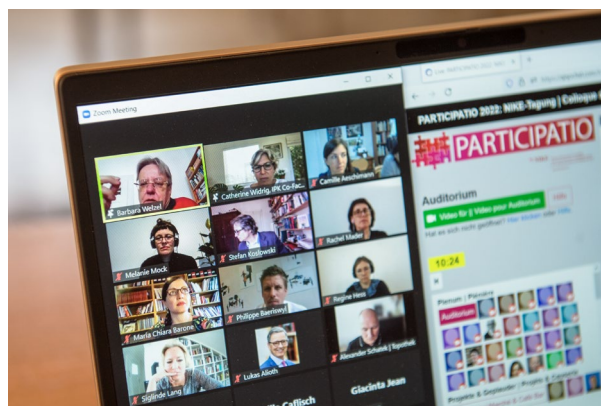
Congrès PARTICIPATIO 2022.

Le congrès « PARTICIPATIO » a été un réel succès et a reçu un accueil très favorable, non seulement grâce à sa forme – la plate-forme virtuelle mise en place a permis des échanges presque aussi libres qu'un véritable centre de conférence – mais aussi en raison des nombreuses discussions qu'il a fait éclore. Ces débats ont aidé à mieux intégrer les approches participatives dans les processus de réflexion.