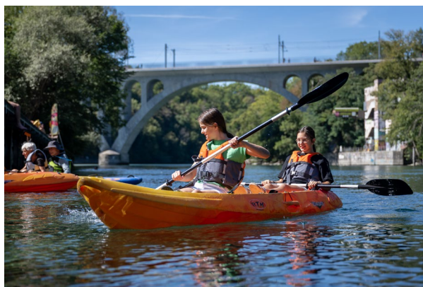
Journées du patrimoine 2022 à Genève : Parcours d'initiation au kayak sur le Rhône.

Le Centre NIKE a conçu la campagne, s'est chargé de la campagne de presse nationale et a apporté son soutien aux coordinateurs des services d'archéologie et des monuments historiques des cantons et des villes. Les lignes de force de la campagne avaient été déterminées lors de la rencontre annuelle de novembre 2021 entre le Centre NIKE et les coordinateurs des cantons. Le Centre NIKE a fait parvenir le matériel promotionnel national à des institutions culturelles et à d'autres organisations ou personnes intéressées. Comme les années précédentes, la campagne se basait sur une combinaison de documents