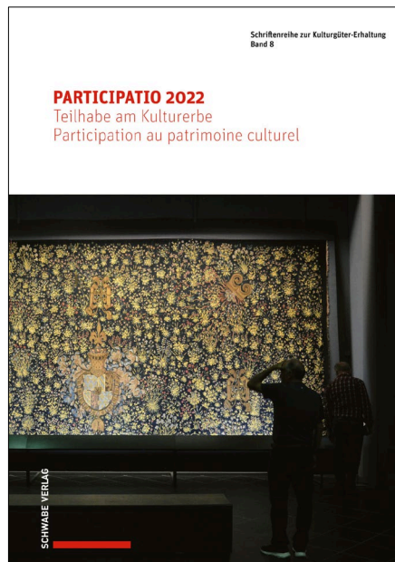
Le volume 8 de la collection « Schriftenreihe zur Kulturgüter-Erhaltung » : Actes du congrès PARTICIPATIO 2022.

Les actes du congrès ont été publiés en décembre 2022 aux éditions Schwabe, à Bâle, comme 8 e volume de la collection « Schriftenreihe zur Kulturgüter-Erhaltung ». Ils sont disponibles sous forme imprimée et sous forme numérique (en libre accès). Comme le congrès lui-même, ils représentent un développement des contenus du guide publié récemment par le Centre NIKE, « La participation au patrimoine culturel ». Le secrétariat du Centre NIKE s'est chargé de la mise au point rédactionnelle de l'ouvrage.