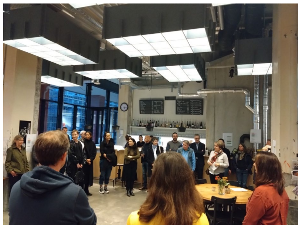
Inauguration de la nouvelle marque faitière le 8 novembre 2022 à Berne. Apéritif à la Cité Holliger.

L'élaboration de la nouvelle conception des Journées du patrimoine a pu être entreprise grâce à une généreuse contribution financière de l'OFC. Le coût de développement de la marque faitière s'est élevé à 48 900 francs. L'OFC a soutenu ces travaux à hauteur de 36 500 francs, l'ASSH de 5000 francs et la CSCM 2 et la CSAC 3 de 2500 francs chacune. Pour développer sa nouvelle plate-forme numérique, le Centre NIKE a besoin d'un montant total de 370 000 francs. L'OFC lui a déjà accordé dans ce but 107 500 francs et la Fondation Ernst Göhner 40 000 francs. Le Centre NIKE est actuellement à la recherche d'autres soutiens financiers.