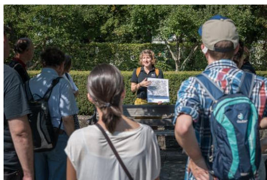
La compétence et la passion des spécialistes sont communicatives.

En mai 2020, le programme comprenait quelque 320 manifestations ; 243 d'entre elles ont finalement pu avoir lieu, ce qui représente une diminution de près de 40 % par rapport à l'année précédente (424 en 2019). Les Journées du patrimoine 2020 ont attiré près de 20 000 personnes (53 000 en 2019), dont environ la moitié en Suisse romande 3 . La diminution par rapport à 2019 est donc de 60 %. La moyenne de fréquentation par lieu a été de 80 personnes en 2020 (125 en 2019). Pour presque toutes les manifestations, le nombre de visiteurs était limité et le nombre maximum a été rapidement atteint.